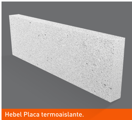
Hebel Placa termoaislante.